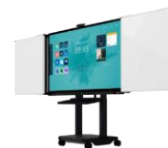
Extensia iPro Whiteboard