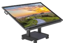
Prowise iPro Tilt & Toddler Lift

Standuri mobile, camere web, module OPS, telecomenzi, softuri educaționale și alte echipamente