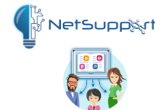
NetSupport Classroom & mozabook