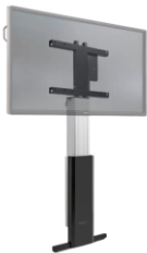
CTOUCH Wallom2 Wall Lift