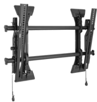
Chief Medium Fusion Wall Mount

Standuri mobile, camere web, module OPS, telecomenzi, softuri educaționale și alte echipamente