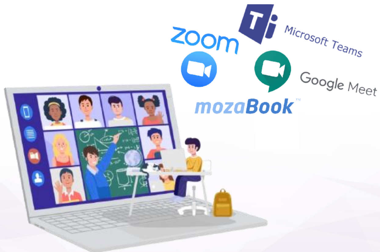
Tabla Interactiva Evolution 150" | 381 cm se integreaza nativ cu solutiile de invatamant la distanta prin Zoom, Google Meet, Hangouts, StarLeaf, Microsoft Teams si orice alta aplicatie de invatamant la distanta sau videoconferinta sprijind modul de predare interactiv.

Astfel, tot ceea ce lucrati pe tabla interactiva poate fi vazut fara niciun alt accesoriu de ceilalti participanti in timp real. Mai mult, prin functia de a permite control, participantilor li se poate permite sa interactioneze in timp real cu continutul lectiei curente.